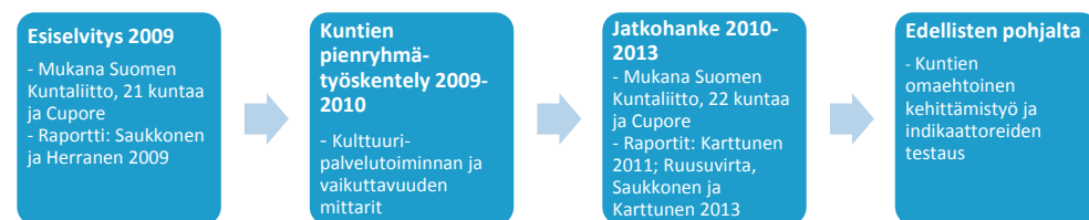
Kuvio 1. Kuntien kulttuuripolitiikan seurannan ja arvioinnin kehittämishankkeen eteneminen

Esiselvityksen valmistuttua syksyllä 2009 hankekaupungit jatkoivat kehittämistyötä keskenään kahdessa pienryhmässä, joista toinen keskittyi kulttuuripalvelutoiminnan ja toinen vaikuttavuuden mittareihin. Syksyllä 2010 Suomen Kuntaliitto teki Cuporen kanssa sopimuksen jatkaa esiselvityksessä aloitettua kehittämistyötä. Jatkohankkeeseen lähti mukaan 22 kaupunkia. Mukaan lähtivät Kajaania lukuun ottamatta esiselvityksessä mukana olleet kaupungit sekä uusina kaupunkina Helsinki ja Pori. Jatkohankkeen tavoitteeksi tuli muodostaa kaikille soveltuva, tarkoin määritelty ja standardoitu indikaattorikokoelma, jonka ympärille